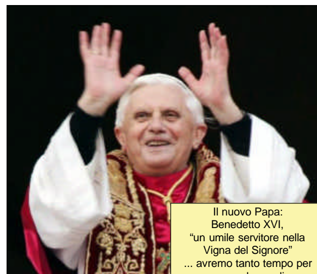
Il nuovo Papa: Benedetto XVI, "un umile servitore nella Vigna del Signore" ... avremo tanto tempo per conoscerlo meglio.